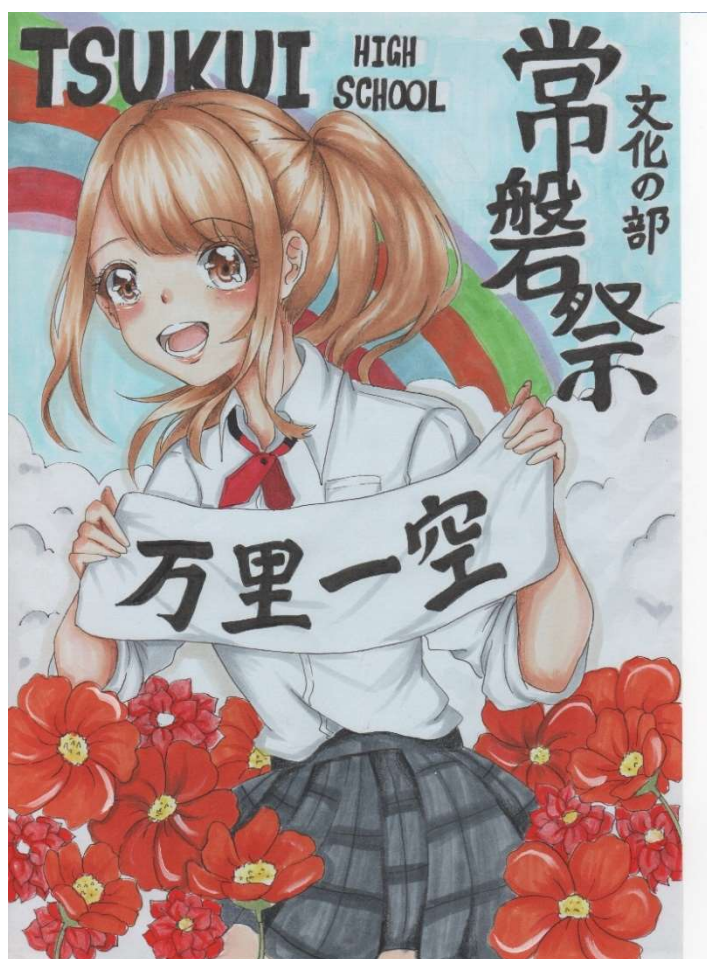
常磐祭（文化の部）ポスター